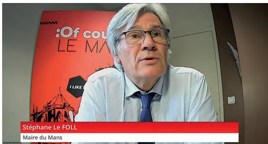
Stéphane LE FOLL, Maire du Mans, ancien ministre de l'Agriculture