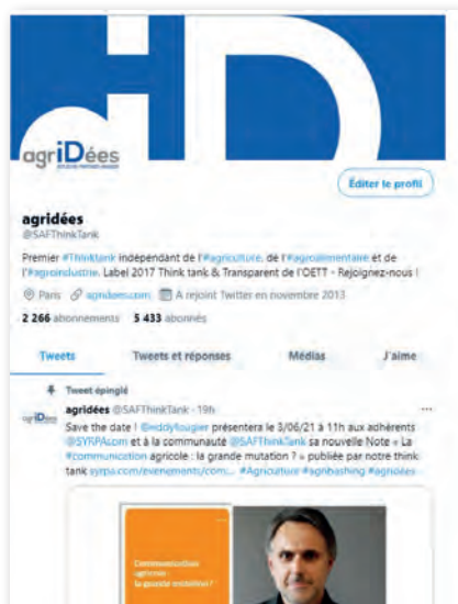
Extrait du compte officiel twitter d'agridées

La chaîne YouTube d'agridées propose enfin à celles et ceux qui suivent nos évènements, de revenir en vidéo sur l'intégralité des débats organisés par notre think tank.