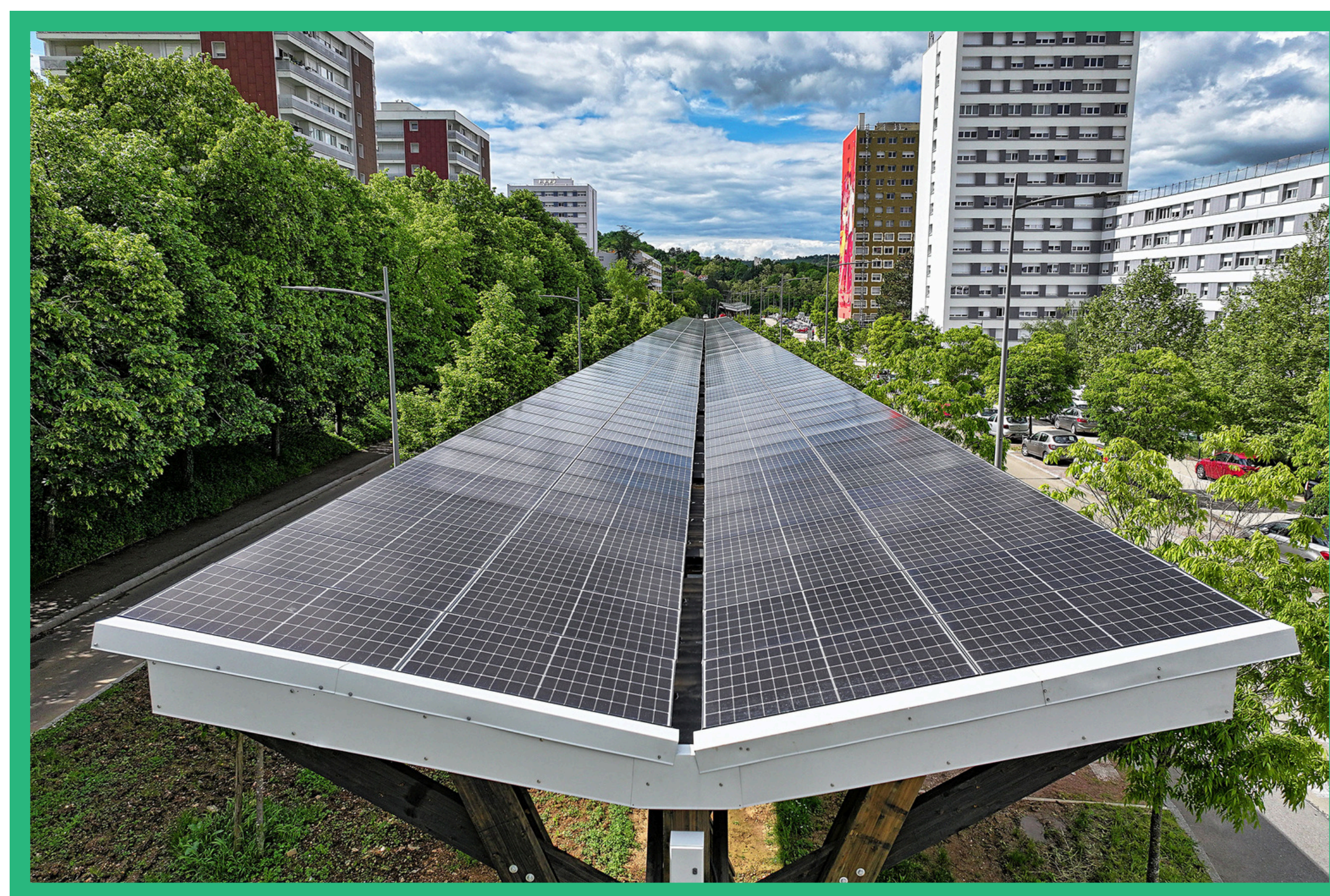
PROJET RESPONSE - . Weckerlé / Dijon Métropole

Pour le dire autrement, la question de l'énergie , mais aussi celle de la biodiversité , sont des défis majeurs qui sont appréhendés de façon transversale dans toutes les politiques publiques portées par la Métropole : urbanisme, aménagement et usage des sols, mobilités, développement économique, alimentation, préservation des ressources, etc. Avec la conviction que l'énergie est un service essentiel auquel chaque citoyen a droit , à commencer par les plus fragiles, impliquant de passer d'une vision moins technique de l'écologie dans les quartiers à une vision qui émancipe les habitants et les rend acteurs de leur territoire.