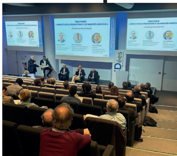
↑ Suivie d'une conférence, l'occasion de présenter la Note tout juste parue.