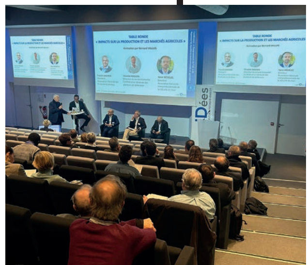
↑ Suivie d'une conférence, l'occasion de présenter la Note tout juste parue.